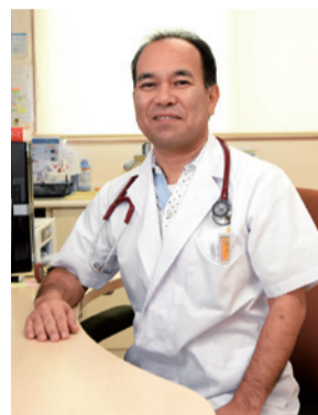
医療法人太平会 理事長 キンザー前クリニック 院長

るシマグワの葉はその効果が高いという研究報告が、15年の日本食品科学工学会第62回大会で報告されています。私は今回、この研究成果を発表した沖縄工業高等専門学校、(公社)浦添市シルバー人材センター、浦添市で構成される研究グループから依頼され、ヒトでの臨床試験